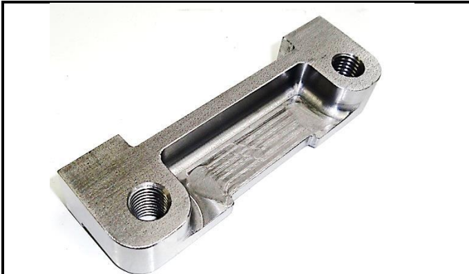
K4-7) Rear brake caliper support