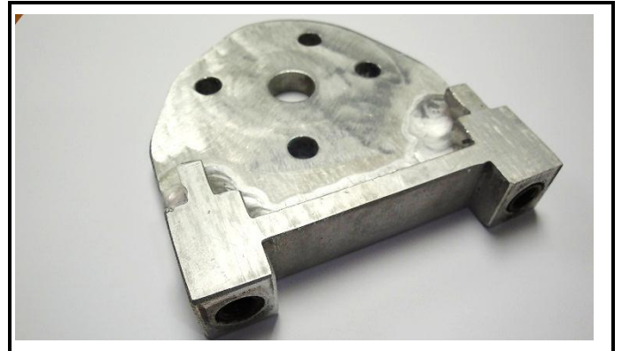
K4-8) Rear brake caliper support