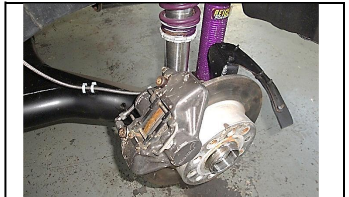
K3-2) Rear brake assembly – zoom on caliper and support