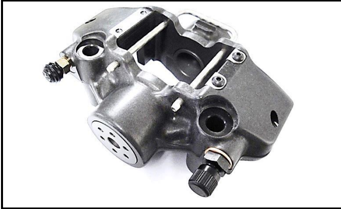
K4-3) Rear brake caliper